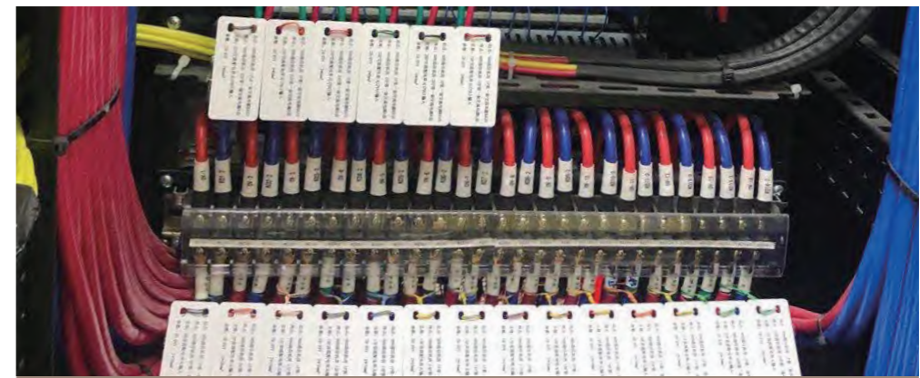
通信线缆标签命名方式及粘贴位置统一，使得机柜内整体美观，后期运维简便。