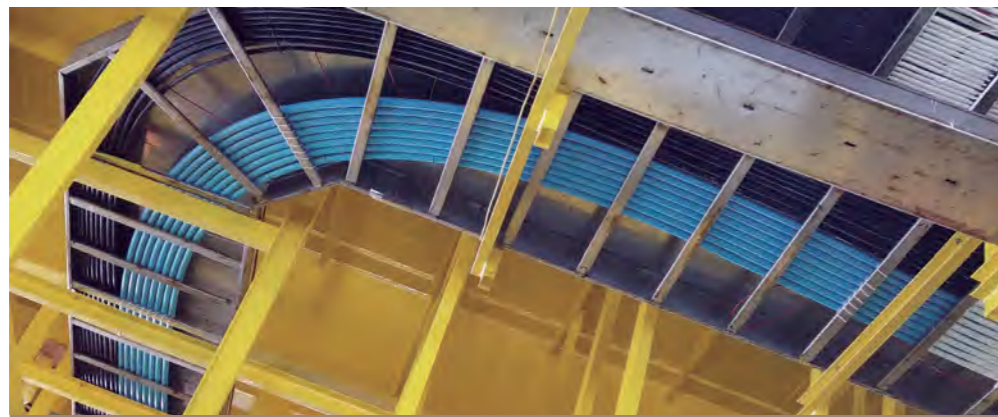
站内通信光缆通过不同路由进行敷设，同时采用阻燃PE管保护，降低运行风险。

Layout and identification of communication cables