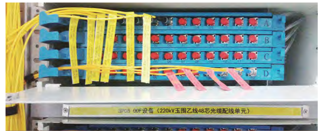
不同通信业务的标签上进行颜色区分，用于区分其业务的重要性。