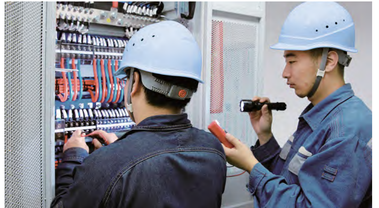
▲ 作业人员检测电源柜